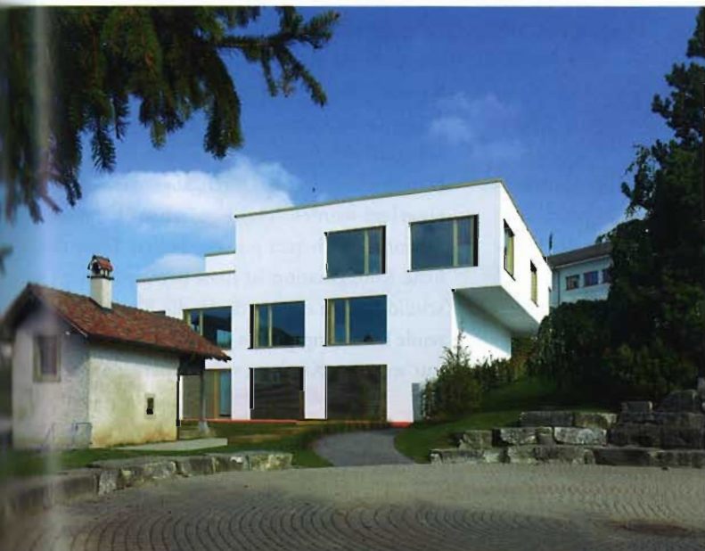
Espace pour enfants in Attalens: Westfassade und Kinderkrippenraum im Gartengeschoss